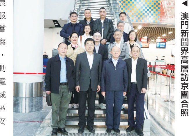
▲ 澳門新聞界高層訪京團合照

展中心, 了解新區整體規劃建設進展情況, 考察容東片區文營社黨群服務中心、新時代文明實踐站, 了解當地宣傳文化工作相關情況, 參觀考察悅容公園, 了解新區生態相關情況, 考察啓動區綜合服務中心, 了解啓動區整體規劃建設進展情況, 考察中電信智慧城市產業園, 了解新區數字城市建設及項目進展情況, 考察啓動區中央綠谷及東部溪谷項目, 了解雄安水城共融生態城市建設情況。